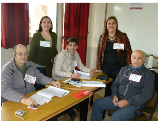
Imagen de su participación en el Café Científico de Investigación Educativa (2015)

Siempre que era invitado a algún evento científico, él inmediatamente se unía a la propuesta. Recuerdo cuando lo invité a colaborar en la Coordinación del Primer Café Científico de Investigación Educativa en las I Jornadas Internacionales de Investigación, Ciencia y Universidad y VII Jornadas de Investigación UMaza (octubre de 2015), le mandé mis primeras ideas y no tardó mucho en responderme, como acostumbraba, enriqueciendo a las mismas. Organizamos, entre otras actividades el juego del cadáver exquisito acerca de cuáles eran los fines de la investigación educativa. Además, propuso desarrollar uno de los Talleres de Ciencia para Científicos de dichas Jornadas, cuyo espíritu era el brindar capacitación en temas relacionados a la investigación científica y que fue llevado a cabo el 8 de octubre, en el cual habló de Herramientas digitales para la escritura académica y también expuso una comunicación oral en el Aula Magna de la UMaza sobre ¿Estudiante milenio en la universidad?